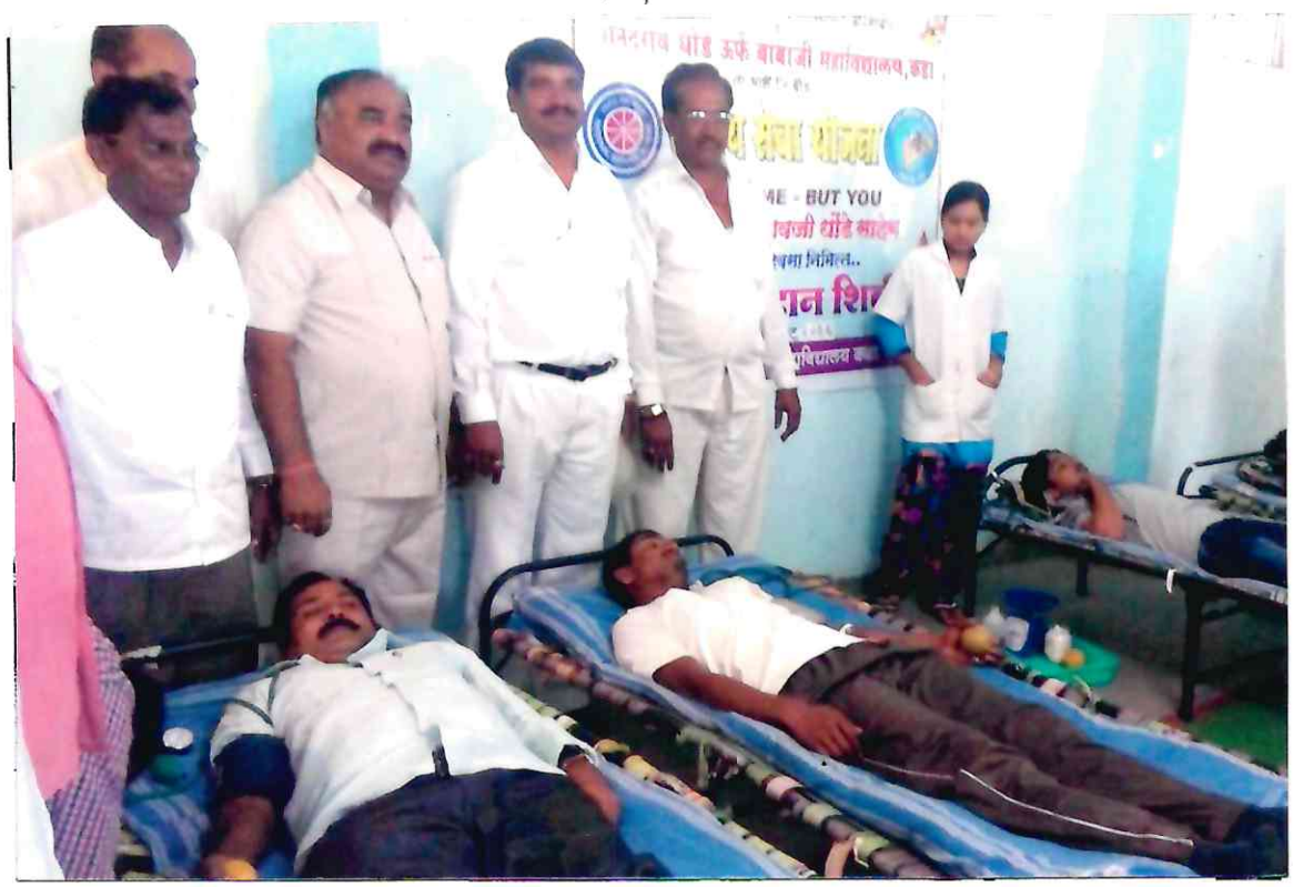
रक्तदान शिक्षिरामको ध्रायेष वर्क्ष रक्तदान करठारे सा विजय देशमुख भोना यत्कार वुरतोना सहाविद्यालप्राचे प्रानार्घ डेंग छिद्याने एन. डी.